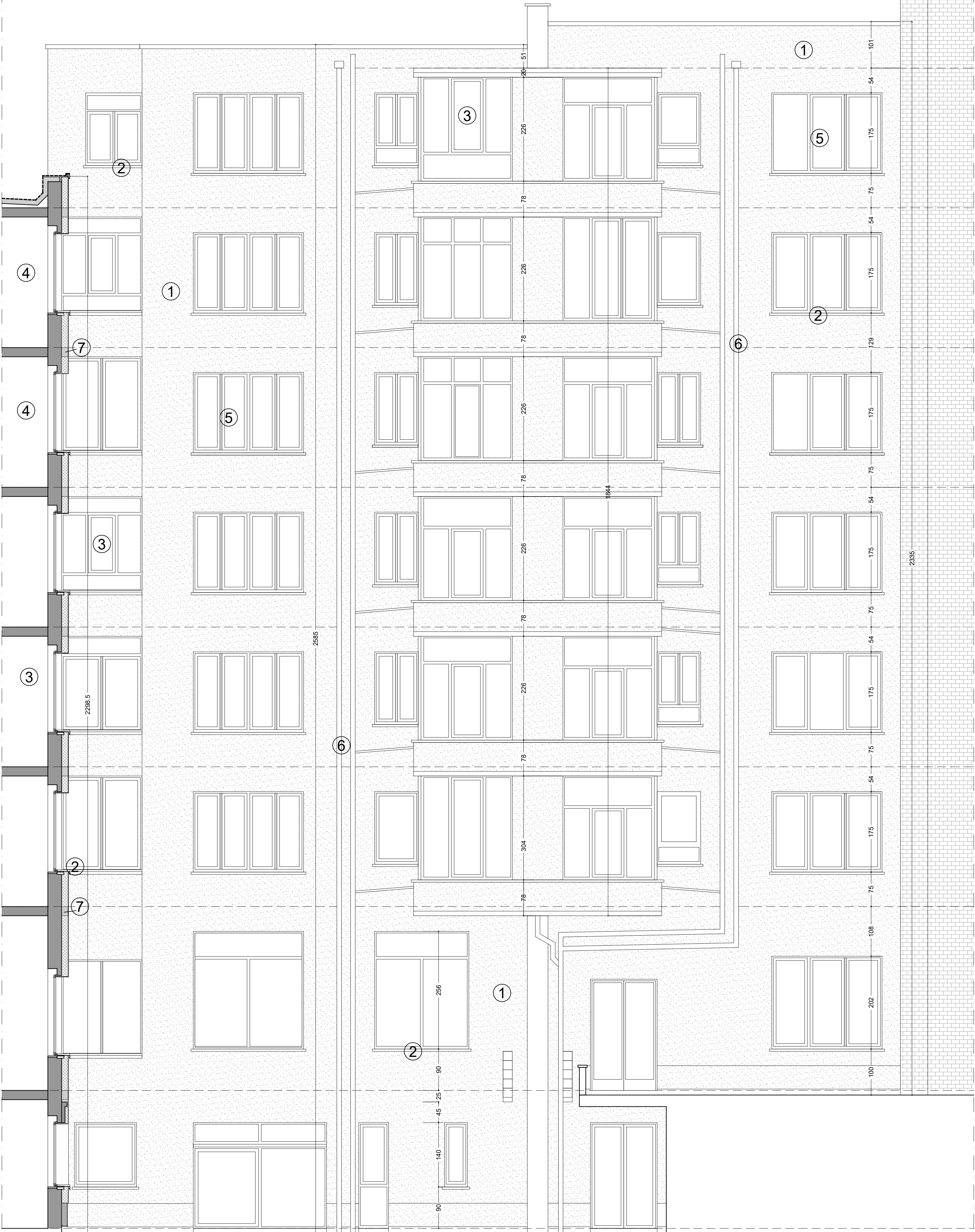
FACADE ARRIERE dimensions à vérifier sur place documents réalisés sur base situation de droit